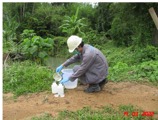
คลองขนานช่วงบริเวณท่อลอดทางหลวงหมายเลข 401