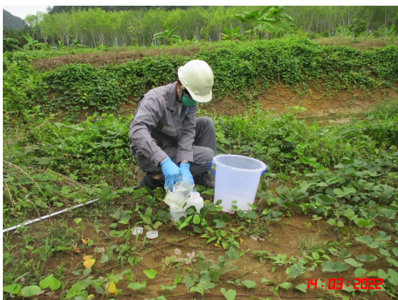
คลองขนานช่วงก่อนถึงท่อลอดทางหลวงหมายเลข 401