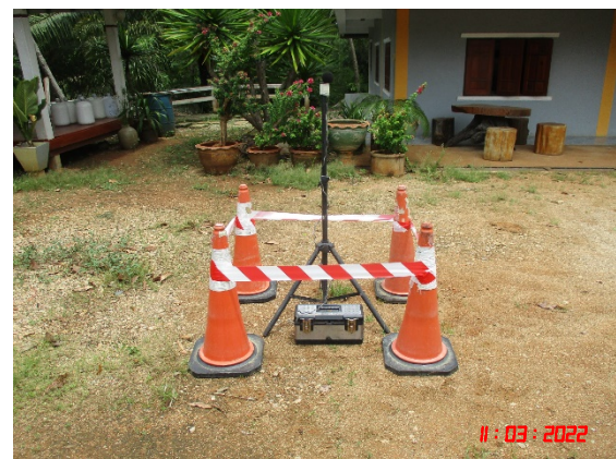
หมู่ที่ 7 บ้านคลองขนาน ทางด้านทิศตะวันออกเฉียงเหนือ