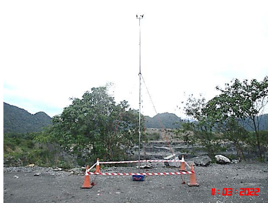
โรงโม่บดและย่อยหินของโครงการ