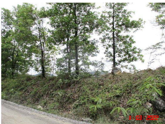
คั่นทำนบดิน