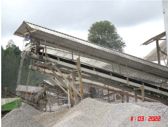
หลังคาปิดคลุมสายพานลำเลียง