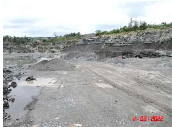
รูปที่ 2-13 การฉีดพรมน้ำในพื้นที่โครงการ