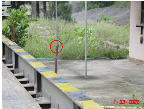
รูปที่ 2-18 แนวต้นไม้รอบโรงโม่บด และย่อยหิน