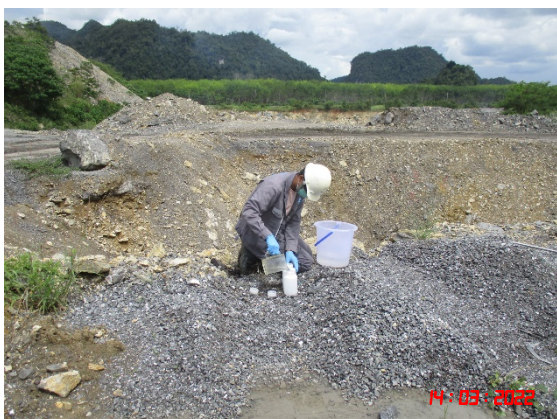
บ่อดักตะกอนทางด้านทิศเหนือ (1)