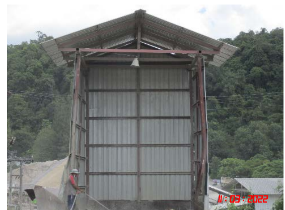
อาคารปิดคลุมยังรับหินใหญ่