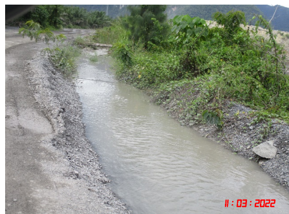
คูระบายน้ำ