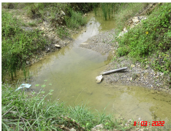
บ่อบรับน้ำทางด้านทิศเหนือใกล้กับทางออกโครงการ