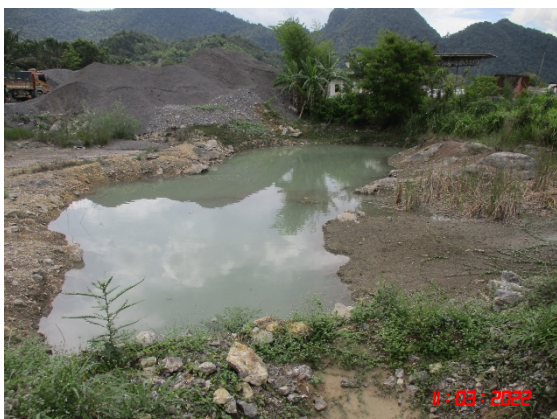
บ่อดักตะกอนทางด้านทิศใต้ของโครงการ