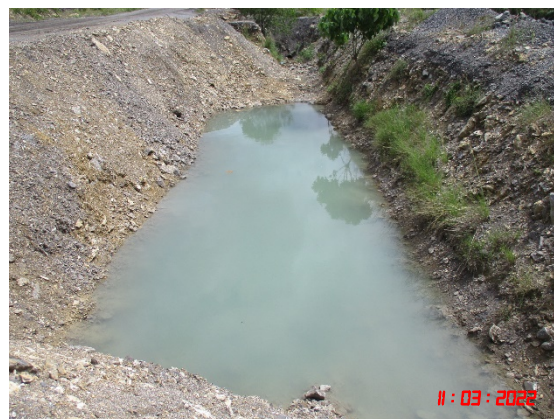
บ่อบรับน้ำทางด้านทิศเหนือใกล้กับทางออกโครงการ