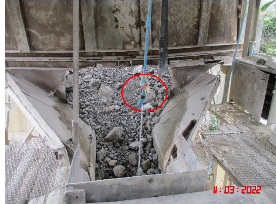
ระบบสเปรย์น้ำ