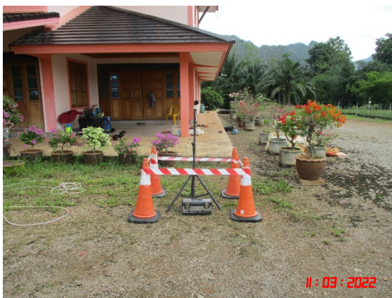
หมู่ที่ 7 บ้านคลองขนาน ทางด้านทิศตะวันตกเฉียงเหนือ