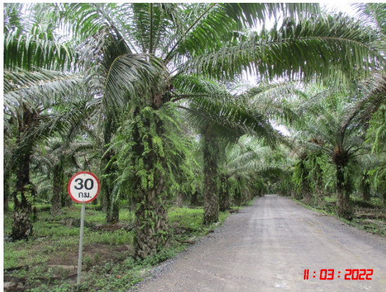
รูปที่ 2-6 เส้นทางขนส่งแร่บริเวณจุดเปิดหน้าเหมือง