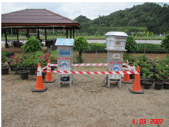
หมู่ที่ 7 บ้านคลองขนาน ทางด้านทิศตะวันตกเฉียงเหนือ