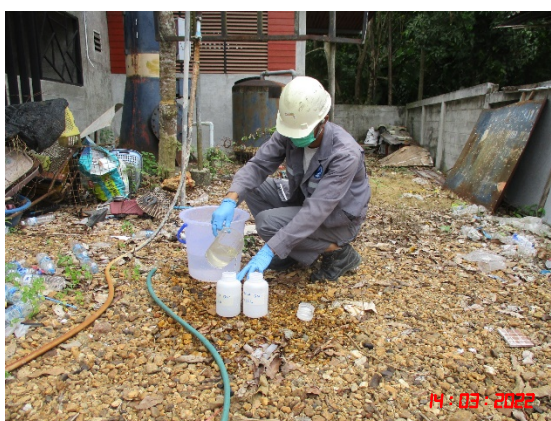
หลุมที่ 7 บ้านคลองขนาน