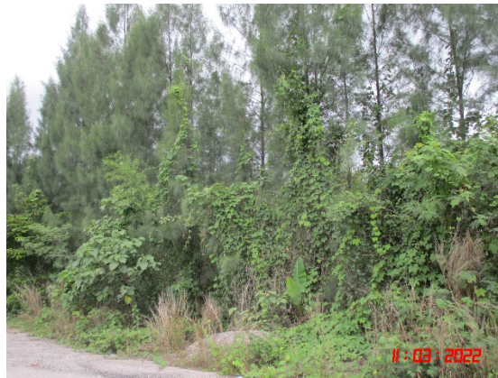
รูปที่ 2-19 แนวต้นไม้โดยรอบพื้นที่โครงการ