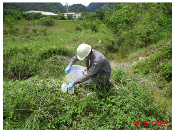
บ่อดักตะกอนทางด้านทิศเหนือ (2)