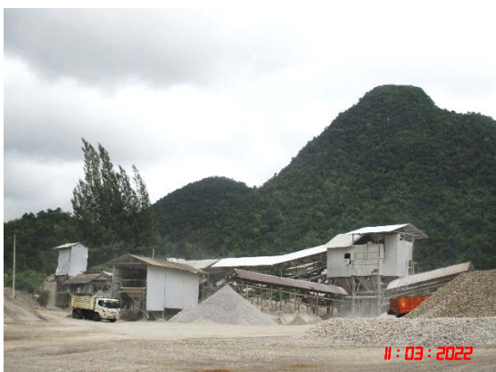
อาคารปิดคลุมโรงโม่หิน