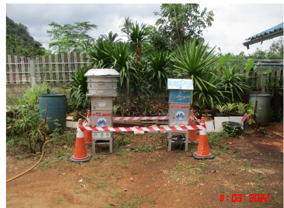
หมู่ที่ 7 บ้านคลองขนาน ทางด้านทิศตะวันออกเฉียงเหนือ