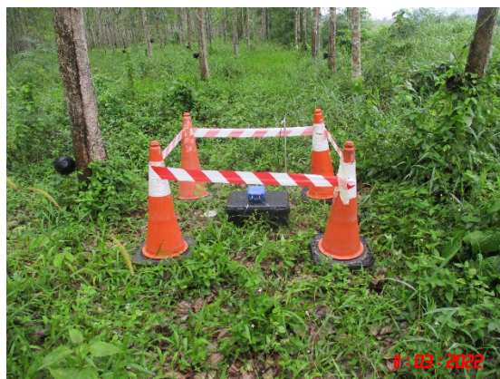
แนวเขตโครงการทางด้านทิศเหนือระหว่างหลักหมุดที่ 13-14